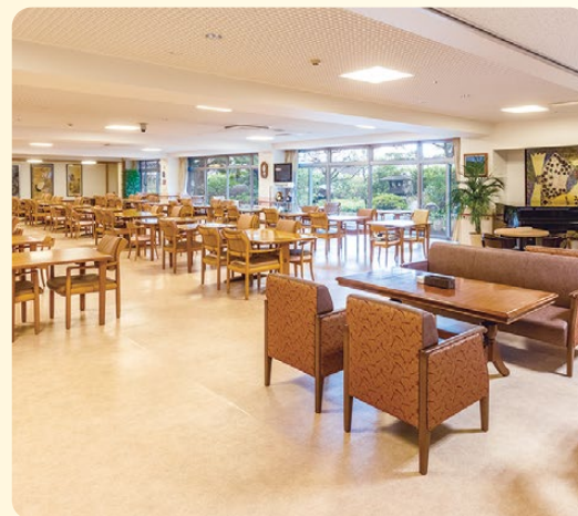
広々とした開放的な食堂