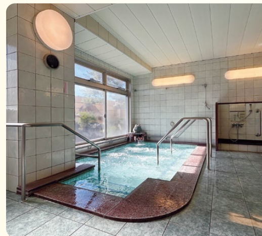
ジェット付の リラックスできる大浴場