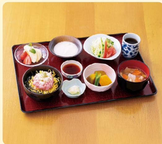
美味しいと評判のお食事